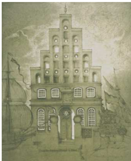
Die Schiffergesellschaft mit Stelen*