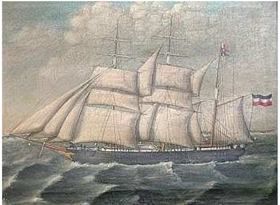
Die Danziger Bark MAJOR VON SAFFT / HB