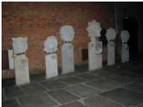
Stelen hinter dem Arturshof / HB

Die Art der Stelen, wie sie auf der Abbildung vor der Schiffergesellschaft (oben) gezeigt werden, sind venezianischen Ur-