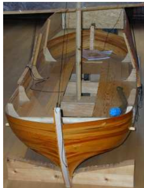
Das Model der Wismarner Kogge / HB

Anschließend besichtigten wir das hier abgebildete Model einer Kogge, deren Vorbild bei Wismar im Nass der Ostsee entdeckt und von Archeologen vermessen worden ist. Durch ein öffentlich gefördertes Projekt wird diese Kogge jetzt im Maßstab 1:1 nachgebaut und soll nach dem Stapellauf u.a. auch für Ostseefahrten gebucht werden können. Wie war es damit ?