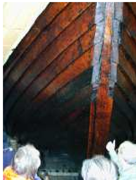
Der Bug des Nachbaus / HB

Anschließend besichtigten wir das hier abgebildete Model einer Kogge, deren Vorbild bei Wismar im Nass der Ostsee entdeckt und von Archeologen vermessen worden ist. Durch ein öffentlich gefördertes Projekt wird diese Kogge jetzt im Maßstab 1:1 nachgebaut und soll nach dem Stapellauf u.a. auch für Ostseefahrten gebucht werden können. Wie war es damit ?