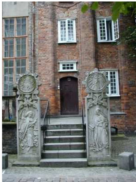
Stelen vor der Frauengasse Nr.1

sprungs und waren auch im alten Danzig häufig anzutreffen. Im 16. Jahrhundert sind die Stelen dann mehr und mehr durch die gewichtigeren Beischläge verdrängt worden. Das folgende Foto zeigt die Stelen, die heute wieder vor dem Haus in der Frauengasse 1 zu sehen sind. HB